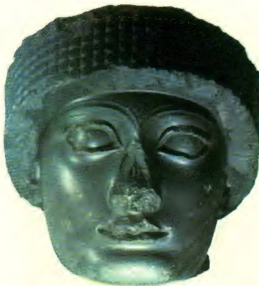
Cabeza de Gudea, llamada "del turbante", que, a pesar de sus mutilaciones, muestra la fuerte personalidad del rey de Lagash (Museo del Louvre, París).

Las leyes que regulan la propiedad, las ventas, cambios y expropiación, ocupan la mayor parte del código, pero de pronto aparecen otros artículos tan pintorescos como los siguientes: "108. Si una vendedora de vino tiene la medida corta, se echará la ta-